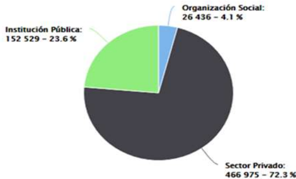
Figura 3: Escolaridad de aprendices vinculados