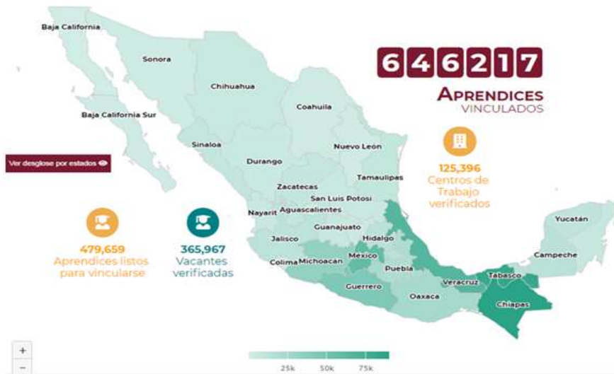
Figura1. Total de aprendices vinculados hasta el momento